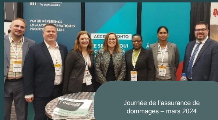
Journée de l'assurance de dommages – mars 2024